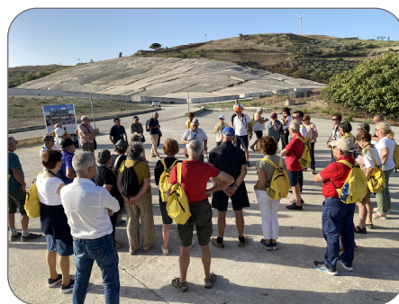
GIBELLINA - Il Cretto di Burri