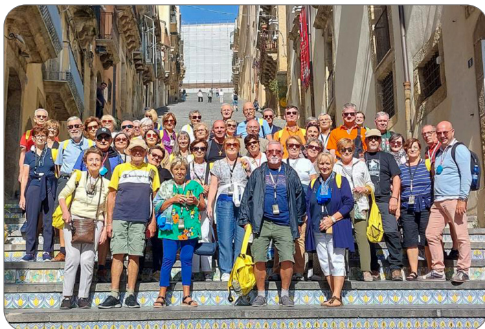
CALTAGIRONE - Scala di S.Maria al Monte