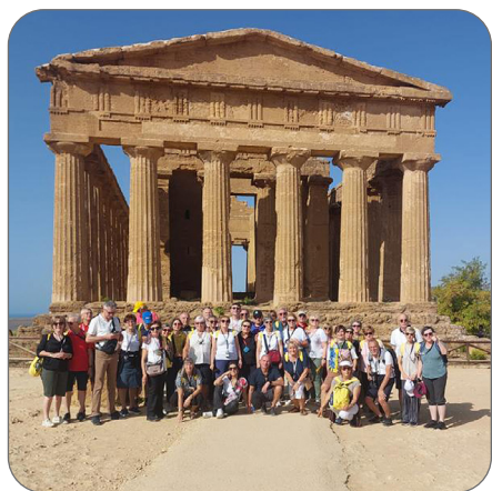
AGRIGENTO - La Valle dei Templi