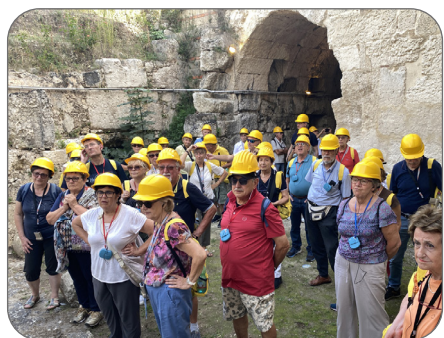
SIRACUSA - Catacombe di S.giovanni