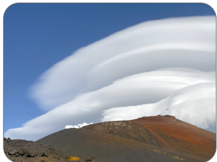
CATANIA - L'Etna