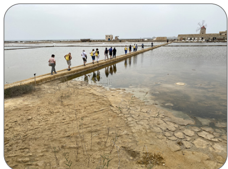
TRAPANI - Le saline