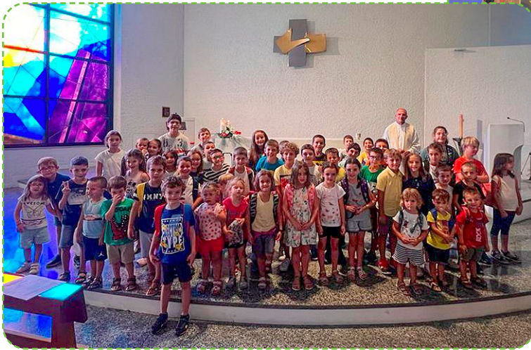
Momento di preghiera all’inizio dell’Anno Scolastico 2023/24