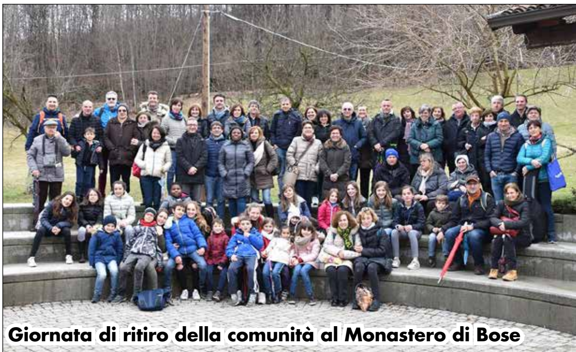
Giornata di ritiro della comunità al Monastero di Bose